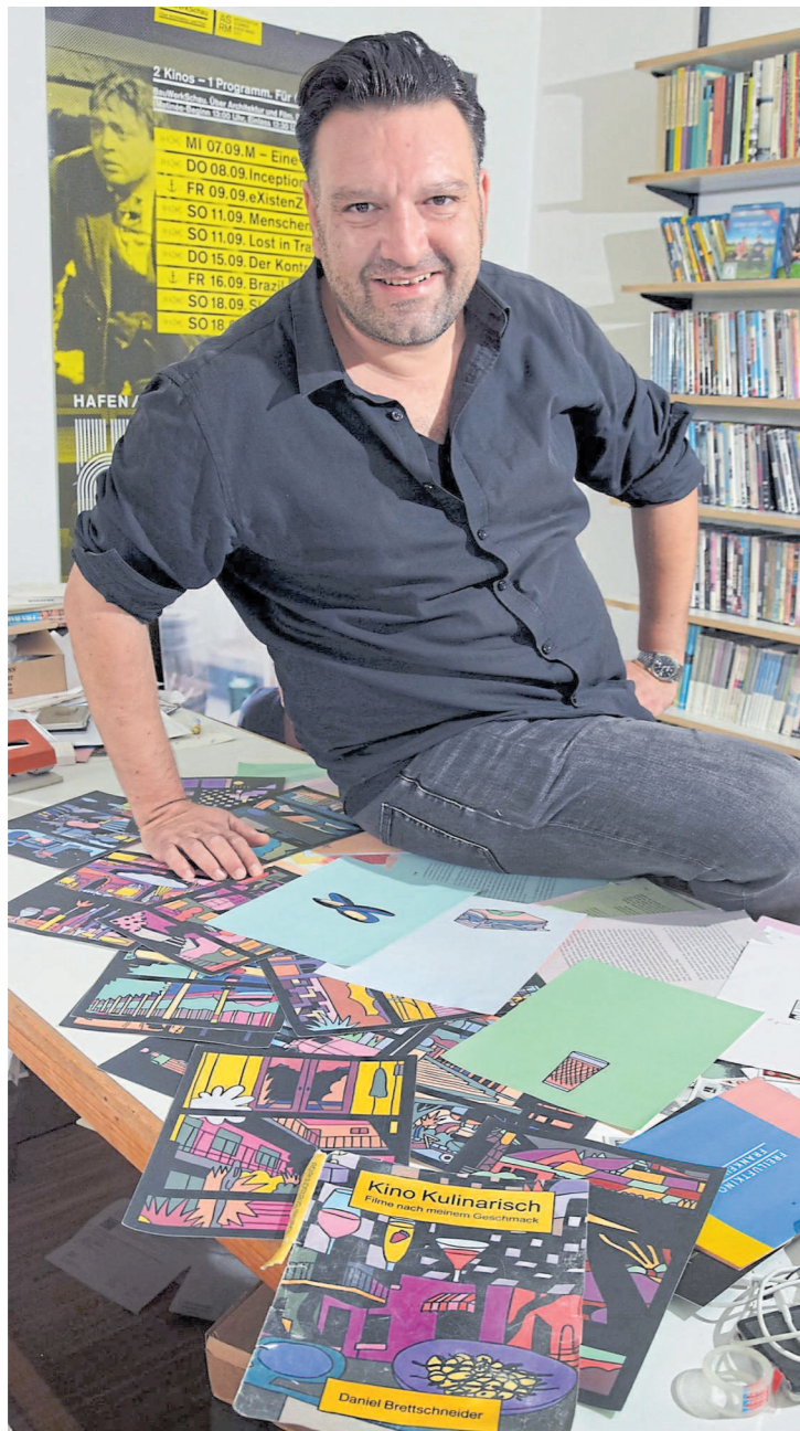
Das Buch ist auch eine Liebeserklärung an Offenbach.