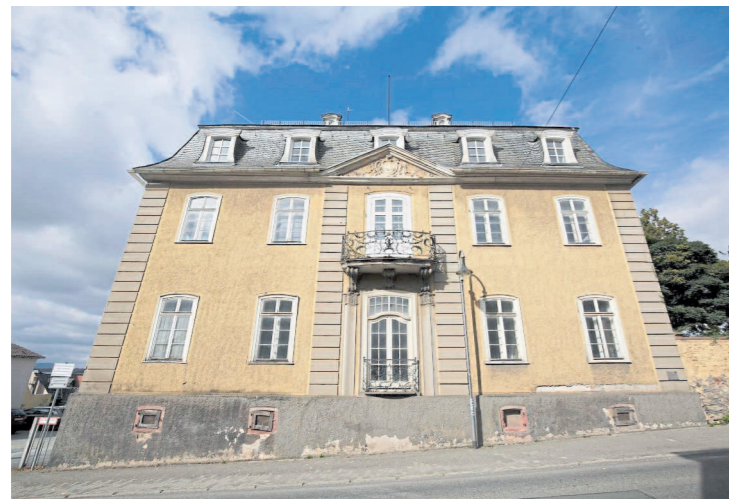
Das Prinzenpalais soll denkmalgerecht saniert werden.

Die anderen Redner erinnerten derweil an die schwierige Investorensuche, die vor allem auf